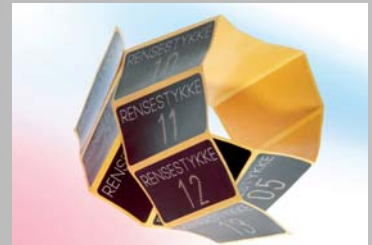
Markieren von Etiketten