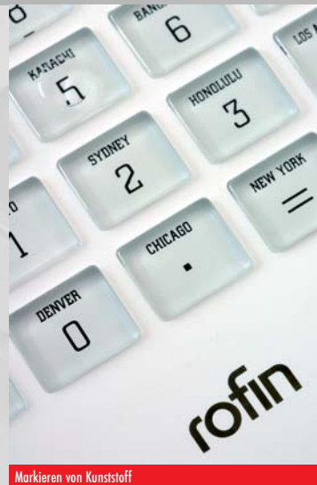
Markieren von Kunststoff