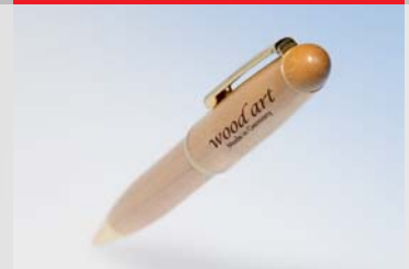
Markieren von organischen Materialien