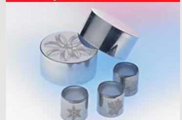
Markieren von Metall

ROFIN-SINAR Laser GmbH Dieselstr. 15 85232 Bergkirchen/Günding Germany Tel.: +49(0)8131-704-0 Fax: +49(0)8131-704-4100 Email: info@rofin-muc.de